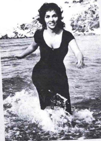
Gina Lollobrigida nel 1958.

— JESSICA BIEL DOPO IL SUO MATRIMONIO PUGLIESE, 19 OTTOBRE 2012.