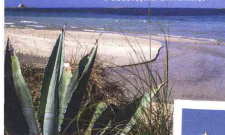
La Riserva naturale di Torre Guaceto, nel Brindisino.

Tra ulivi secolari e masserie design, tra scavi archeologici e spiagge nascoste che piacciono al jet set, per una volta scordatevi il «Salentoshire». Justin Timberlake e Jessica Biel, tra gli altri, l'hanno fatto