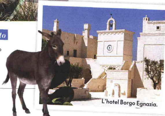
L'hotel Borgo Egnazia.

Non sottovalutate lo zoo safari Fasanolandia: è tra i più grandi parchi faunistici d'Europa WWW.ZOOSAFARI.IT