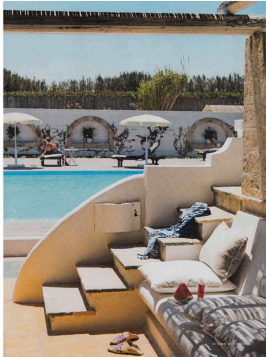
Sopra, l'interno di una delle due Sunbath room che impreziosiscono la struttura, con due bagni e accesso diretto al mare. In alto e a destra, l'esterno con patio di una delle due Pool room, con accesso alle salette a temperatura differenziata e cortile idroterapico.

to in una linea d'insieme che consente ai clienti di vivere ogni momento, nelle camere come negli spazi comuni, l'atmosfera delle dimore marine in tipico stile mediterraneo della costa pugliese. E attendendosi rigorosamente a tali regole non scritte, ma piuttosto perceptive con sensibilità, che questo boutique hotel situato in località Losciale, lungo la costa tra Monopoli e Savelletti, rappresenta una destinazione ideale per coloro che amano la bellezza allo stato natura-